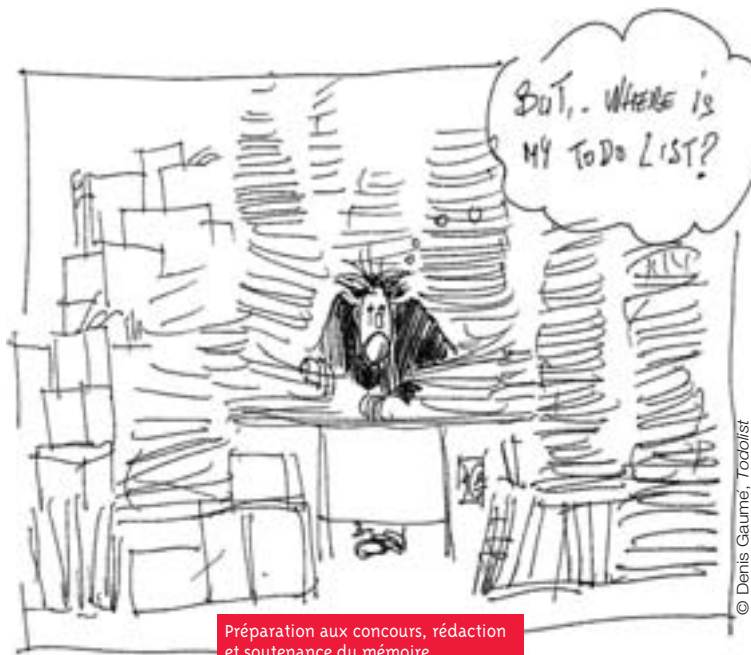
Préparation aux concours, rédaction et soutenance du mémoire, validation des UE tout se bouscule...

Mais comme enseignants des ESPÉ, nous le savons, seule une véritable formation de haut niveau, disciplinaire, didactique et pédagogique, peut produire la construction des compétences professionnelles nécessaires pour que les élèves apprennent et réussissent. C'était toute l'ambition des masters métiers de l'enseignement, de l'éducation et de la formation (MEEF) ! Les maquettes initiales bâties sur deux années universitaires (suivies de l'année de stagiairisation) pouvaient, en dépit de la pression exercée par la préparation des épreuves de concours de recrutement, donner du temps pour se former et se professionnaliser par des stages progressifs. Ce n'est plus du tout le cas, pour autant que cela l'ait été la première année dite de « mastérisation ». C'est pourquoi nous pouvons affirmer notre solidarité avec les professeurs stagiaires, que nous encourageons à s'organiser syndicalement pour se faire mieux entendre, mais nous ne partageons pas leurs revendications (au-delà