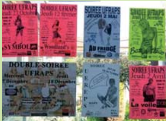
Les affiches des fêtes du STAPS de Lyon.

Ces questions sont abordées en STAPS puis en ÉSPÉ, notamment parce que les programmes du CAPEPS les imposent. Ce pilotage