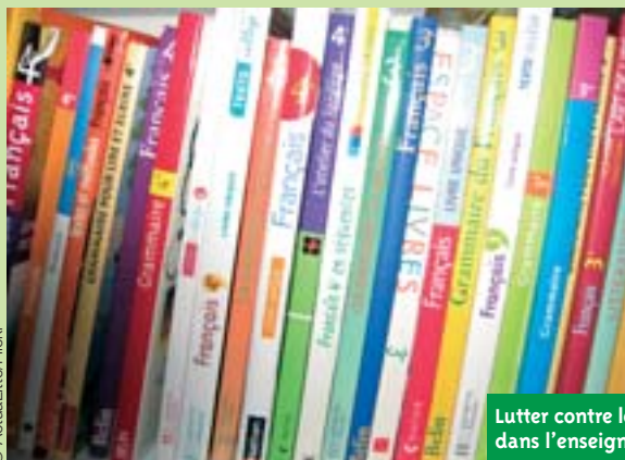
Lutter contre les stéréotypes dans l'enseignement du français.