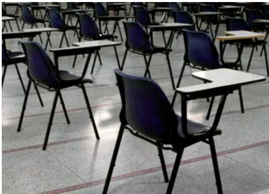
Le concours, un principe de base.

Toutefois les concours, tels qu'ils sont mis en œuvre, ne sont pas exempts de critiques. Les concours de recrutement dans la FDE jouent à la fois le rôle de pilotage de la formation, ce qui est très discutable, en imposant des contenus (au détriment d'autres) et des formes d'épreuves qui ne font pas consensus, et le rôle de sélection entre les candidats, ce qui est bien leur fonction première. Dans ce flou des rôles assignés aux concours, des débats ont eu lieu sur la nécessité de les « professionnaliser ». Cet objectif du ministère s'est traduit par de nouvelles épreuves visant à vérifier toujours des connaissances mais aussi des compétences « professionnelles ». Ce concours, actuellement placé, pour des raisons budgétaires, au milieu du master « métiers de l'ensei-