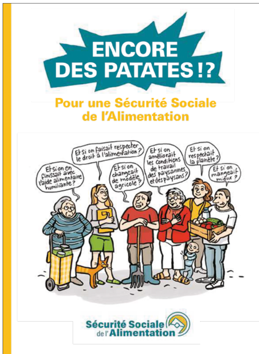
Une bande dessinée pour présenter les enjeux et les bases du projet de sécurité sociale de l'alimentation. Pour lire le premier chapitre et découvrir comment se procurer la BD, voir l'article dédié à celle-ci : https://miniurl.be/r-4b5k

cotisants, aurait pour mission d'établir et de faire respecter les règles de production, de transformation et de mise sur le marché de la nourriture choisie, et donc conventionnée, par les cotisants. Ces 150 euros par mois devraient permettre durablement à tous, y compris les plus précaires, un bien meilleur accès à une alimentation choisie, d'une qualité définie démocratiquement. Une SSA obligera les professionnels de l'agriculture et de l'agroalimentaire, s'ils veulent accéder à ce « marché », à une production alimentaire conforme aux attentes des citoyens.